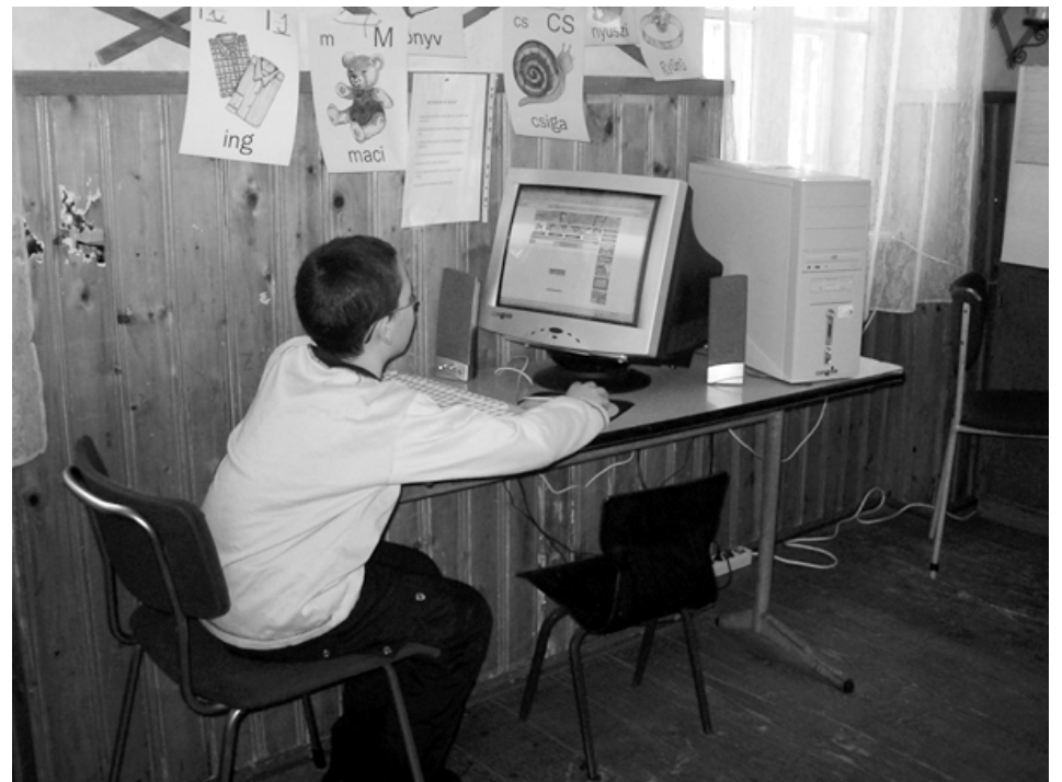
A hétfalusi eMagyar Pont (Csernátfalva, Zajzoni Rab István Középiskola)

Üdvözljük a verseny megszervezését, érdekes és tartalmas színfolt az erdélyi települések életében.