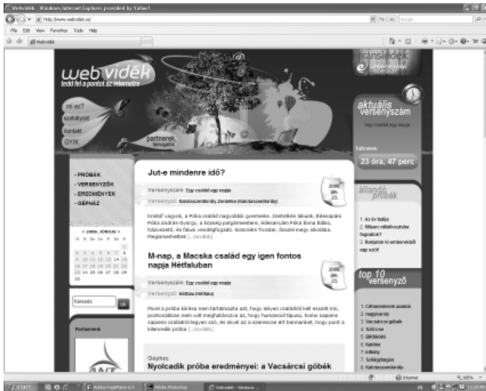
A Webvidék bejelentkező oldala (www.webvidek.ro)

A teljes szöveget írjátok át, a pontok helyére szabadon írjátok be a szerintetek oda találó szavakat. Próbáljátok elképzelni, hogyan mesélné el egy falubéletek a szöveget, miután elolvasta a részletet. Engedjétek szabadon a fantáziátok!